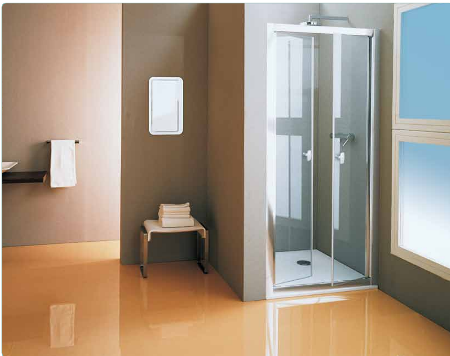
Cabina doccia, art. B7232ULUTR Piatto doccia, art. D4090S01

Porta a saloon, apertura ad ante battenti verso l'interno e verso l'esterno.