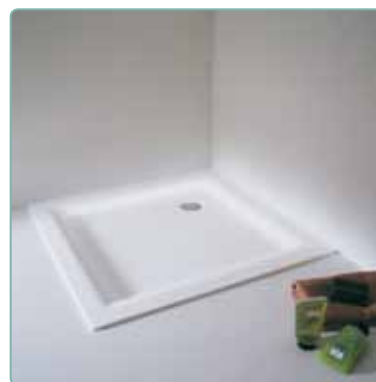
Abbinabili a piatto doccia samo (vedere pagine area dedicata)