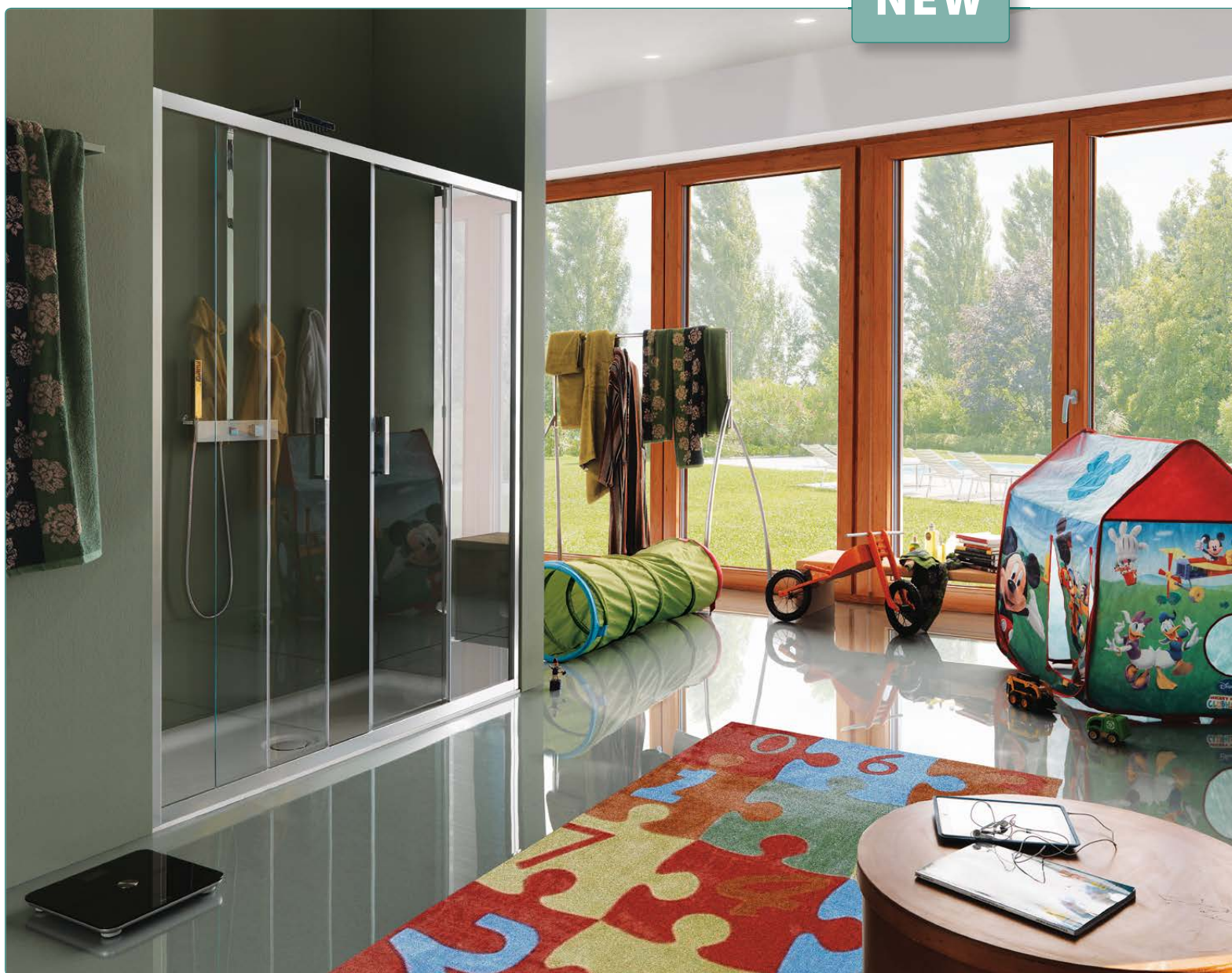
Cabina doccia, art. B0947ULUTR Piatto doccia, art. D4170S01 Sistema doccia, art. YA1015.121CRO

Porta scorrevole a quattro ante, con apertura centrale ad ante scorrevoli, due fisse e due apribili.