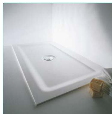
Abbinabili a piatto doccia samo (vedere pagine area dedicata)