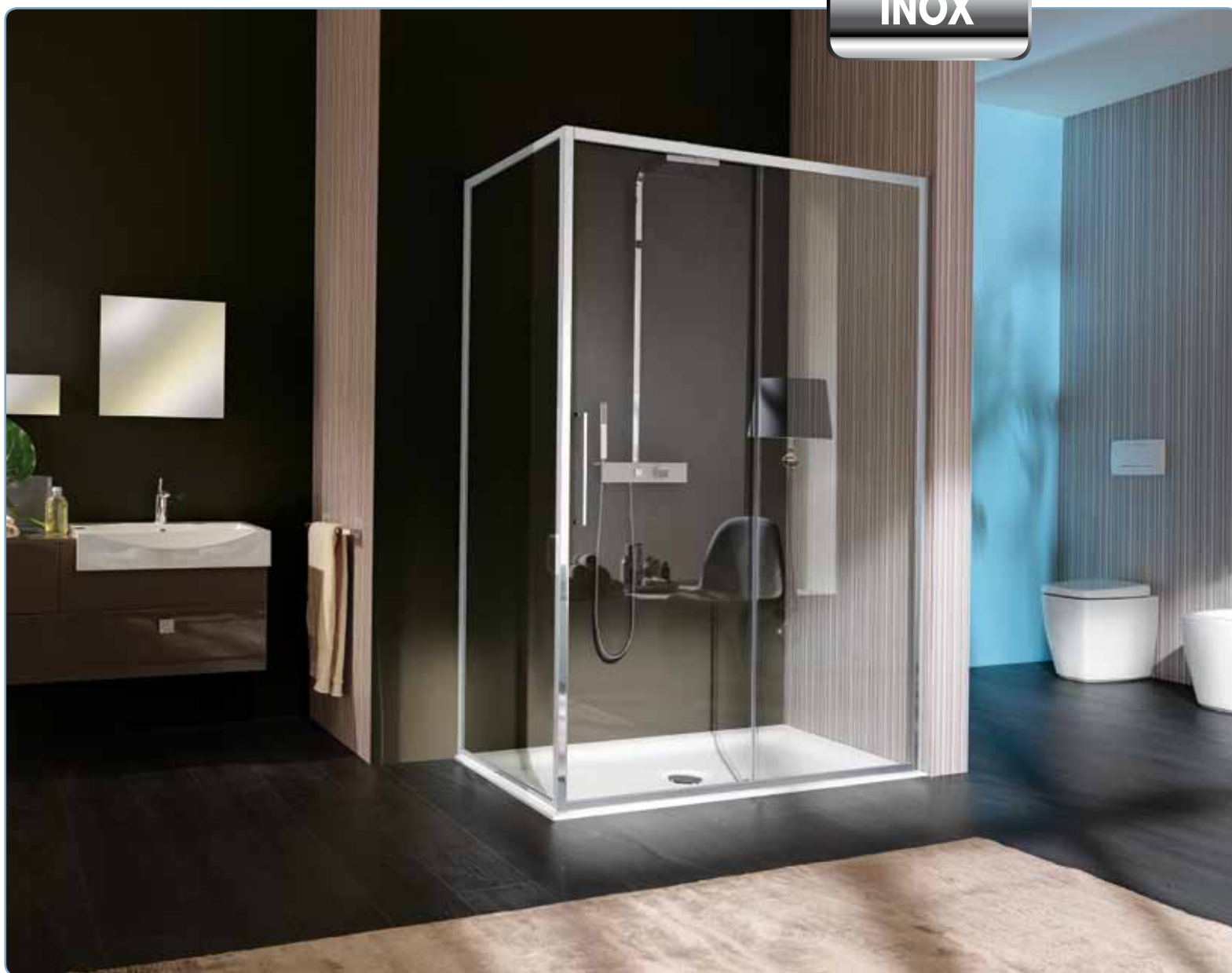
Cabina doccia, art. B8345LUCTR Parete fissa, art. B8325LUCTR Piatto doccia, art. D4177S01 Sistema doccia, art. YA1015.121CRO

Porta scorrevole a due ante. Apertura laterale ad anta scorrevole, una fissa (6 mm.) ed una apribile (8 mm.)