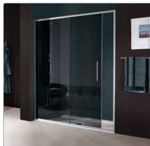
Carter copri viti Optional, Art. KT8300LUC