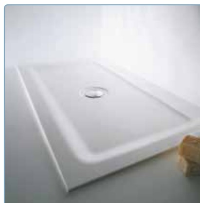
Abbinabili a piatto doccia samo (vedere pagine area dedicata)