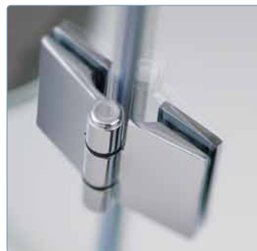
Carter copri viti Optional, Art. KT8300LUC