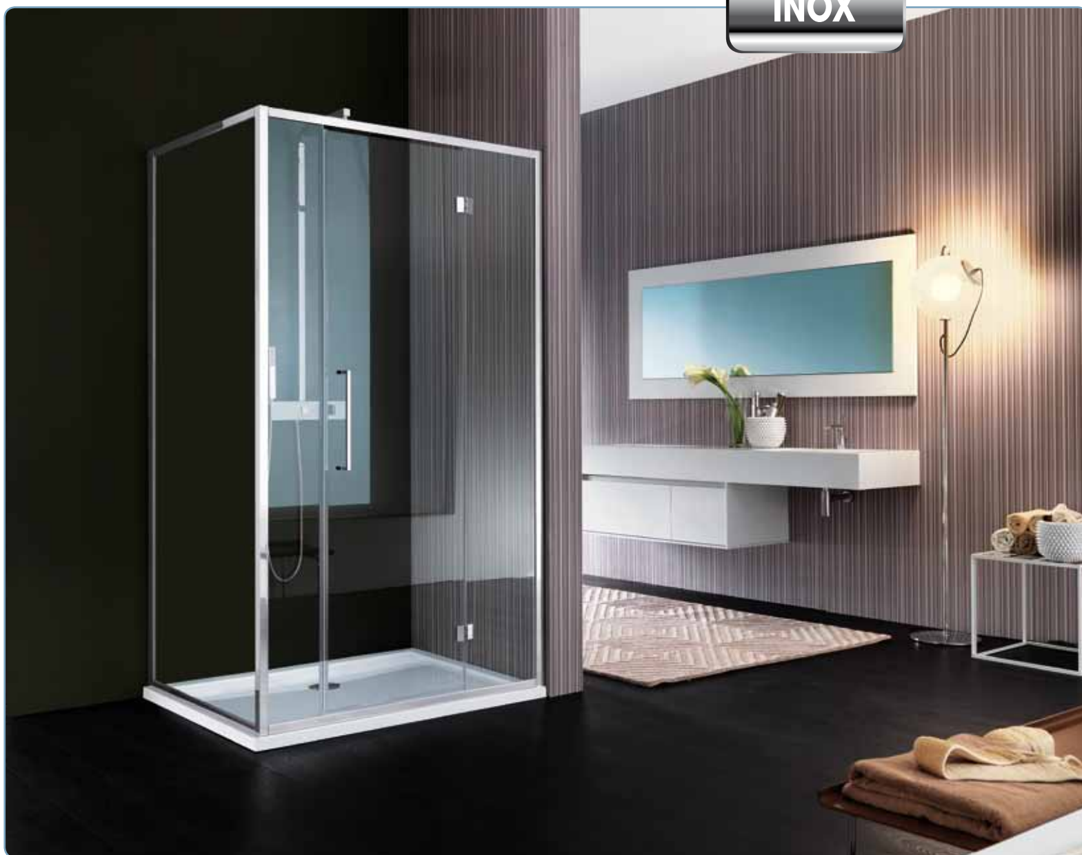
Cabina doccia, art. B8445LUCTR Parete fissa, art. B8325LUCTR Piatto doccia, art. D4177S01 Sistema doccia, art. YA1015.121CRO

Porta a tre ante, due fisse laterali e una apribile frontale verso l'esterno. Apertura ad anta ripiegabile grazie a cerniere snodate a 180° verso l'esterno.