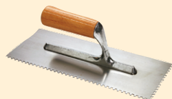
Spatola 8x8 mm