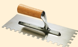
Spatola 10x10 mm