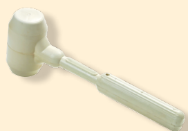
Martello di gomma bianca