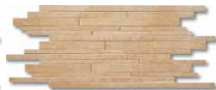
30x60 - 12"x24" Sand