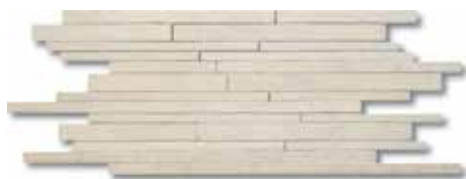
30x60 - 12"x24" White

NATURALE - UNPOLISHED - MATT - NATUREL - НАТУРАЛЬНЫЙ