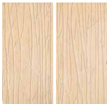
30x60 - 12"x24" Alberi Rose (2 sogg. Assortiti) *