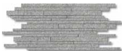
30x60 - 12"x24" Grey