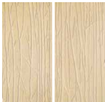
30x60 - 12"x24" Alberi Beige (2 sogg. Assortiti) *