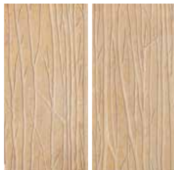
30x60 - 12"x24" Alberi Sand (2 sogg. Assortiti) *