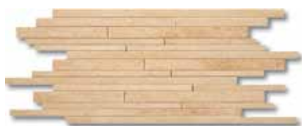
30x60 - 12"x24" Rose