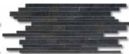
30x60 - 12"x24" Black

Muro su rete in fogli 30x60 - 30x60 / 12"x24" sheet "Wall" on the net - Mauer auf Netz, Blätter 30x60 Mur sur trame de 30x60 - Стена в листах на решетке 30x60