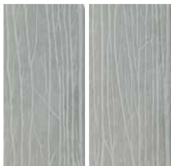
30x60 - 12"x24" Alberi Grey (2 sogg. Assortiti) *