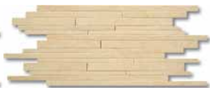
30x60 - 12"x24" Beige