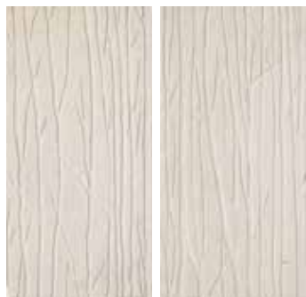
30x60 - 12"x24" Alberi White (2 sogg. Assortiti) *

LUCIDATO/RETTIFICATO - HALF POLISHED/RECTIFIED - HALBPOLIERT/REKTIFIZIERT - SEMI-POLI/RECTIFIE - ПОЛУПОЛИРОВАННЫЙ/РЕКТИФИЦИРОВАННЫЙ